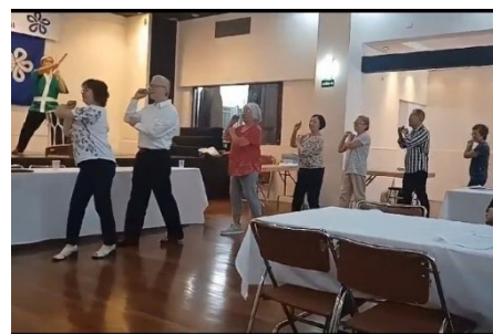
Shinnenkai: dançando Tankobushi. 炭坑節を踊る会員の皆さん