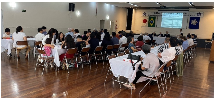
Assembléia: visão geral do salão. 定期総会スナップ