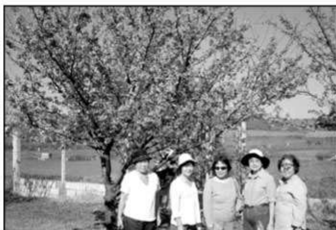
ピクニックに参加したご婦人達