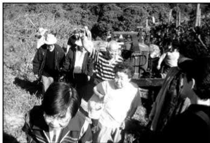
鶴我氏の農場でピワ狩りを楽しむ

モジ ダス クルーゼス支部の招待により、ビリチーバ ミリン市の文化体育協会会館の桜まつりの花見を兼ねた支部交流交歓会を催した。 サンパウロ各支部から40名、スザノ支部より22名の参加者でバス2台の日帰り旅行となり、プログラムにより、途中 モジ市郊外の鶴我氏の農場を訪問、茶菓子などの接待を受け、元気が出たところピワ狩りや散策を楽しんだ。その後、目的地 ビリチーバ ミリン市の文化体育協会会館に向かった。会場では 福岡県人会の協力により、福岡県の日本ブラジル移民100周年慶祝団が大勢で持ち運んでくれた約70匹程の鯉のぼりと市町村旗などを使って、会場いっぱい、桜も忘れられるほどで会館創立以来の豪華に飾られ、来場者ばかりでなく、協会会員たちも、初めて見る光景にびっくり、大喜びをした。