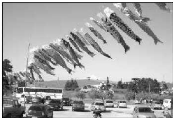
ビリチーバ ミリン文化協会