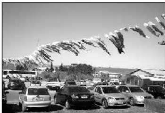
福岡県から寄贈された鯉のぼりが泳ぐ会場