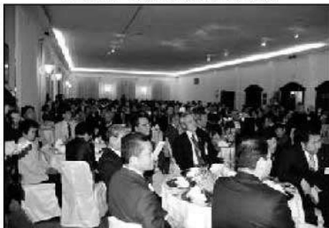
参加者がいっぱいの歓迎会会場