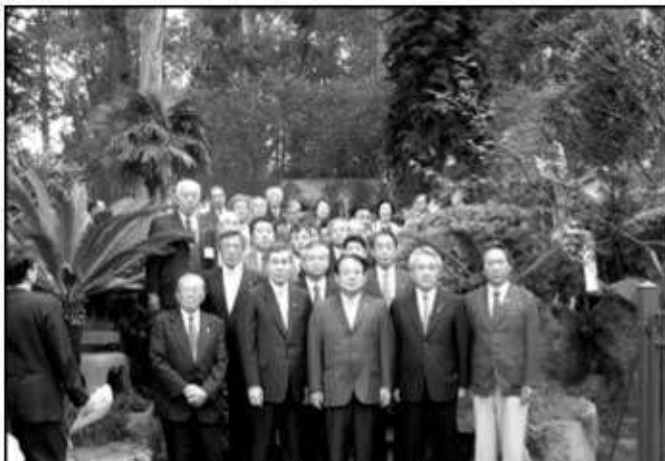
先没慰霊碑の前で