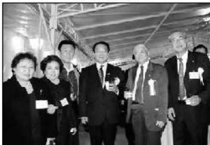
麻生知事 県人会会長たちを激励