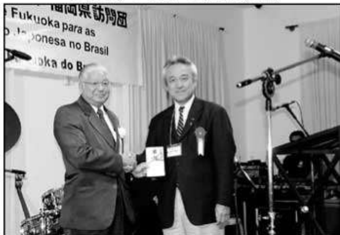
福岡からの記念品贈呈