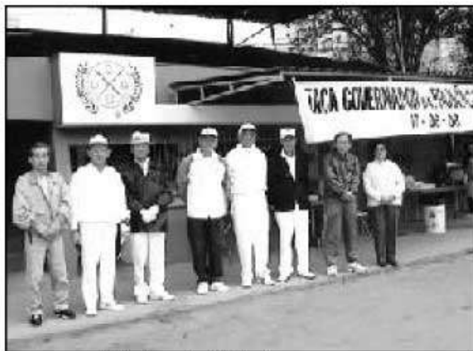
開会式で大会執行部のメンバー

当日は県知事の出席を期待してたくさんのお出 場者が集まったがスケジュールの都合がつかず 残念ながら知事自らの知事杯の授与表彰式は実現 出来なかった。優勝チームはスザノ支部Bチーム