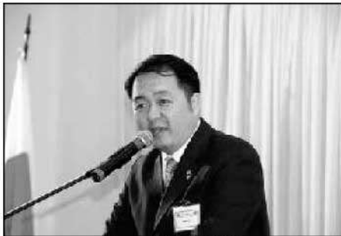
ウー 連邦下院議員