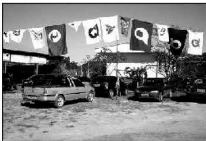
福岡県下の市町村旗来場者を歓迎