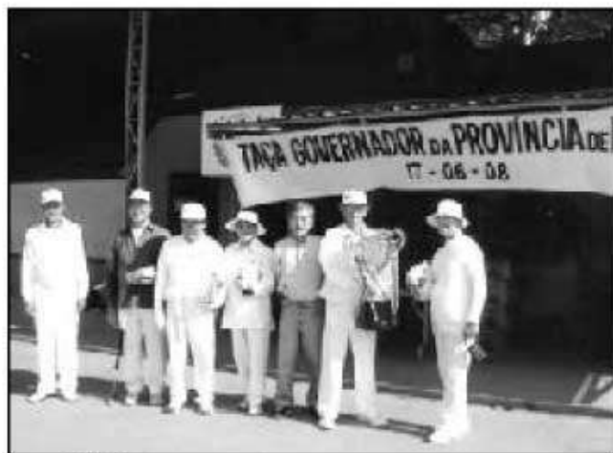
準優勝チーム サント アンドレ チーム