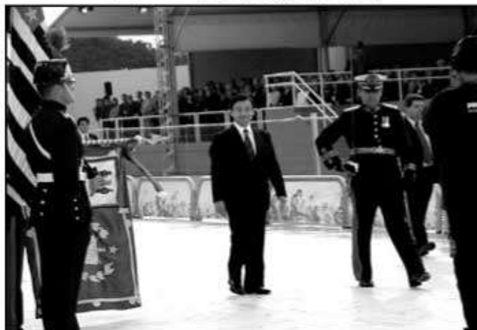
皇太子殿下 式典会場にて