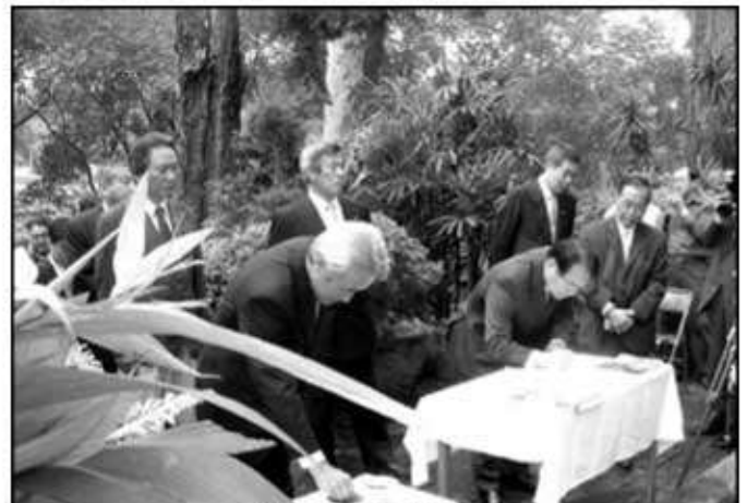
参拝者の記帳 風景