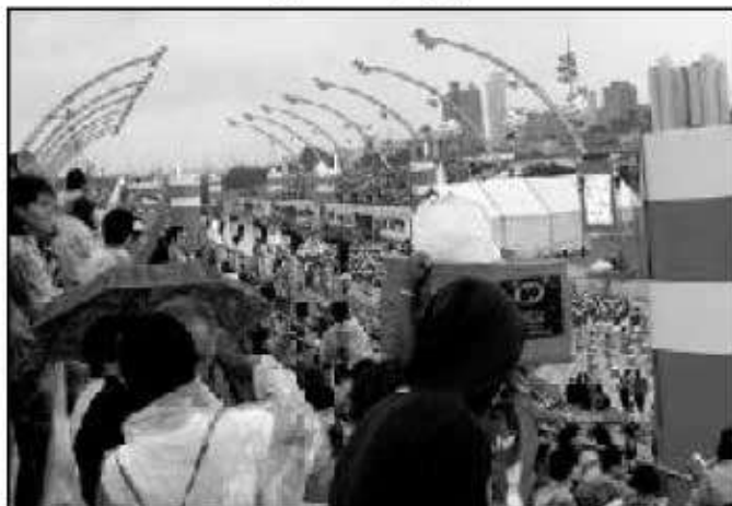
100周年記念式典会場