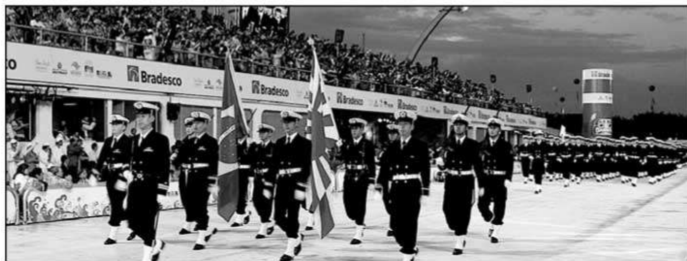
100周年記念式典会場での行進