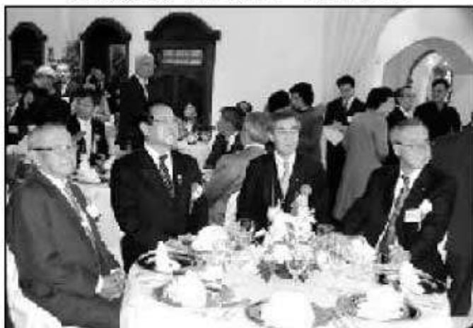
母県「福岡」と県人会の連携を確認