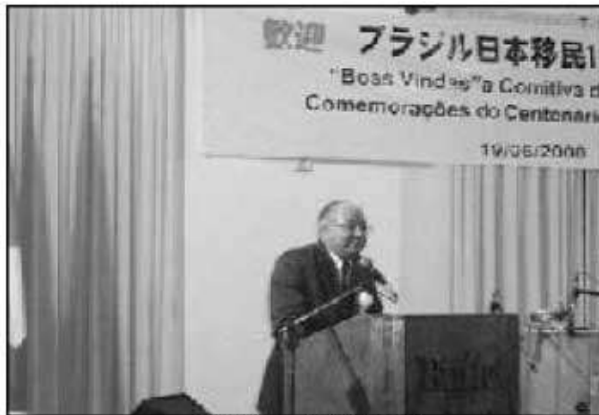
松尾県人会名誉会長