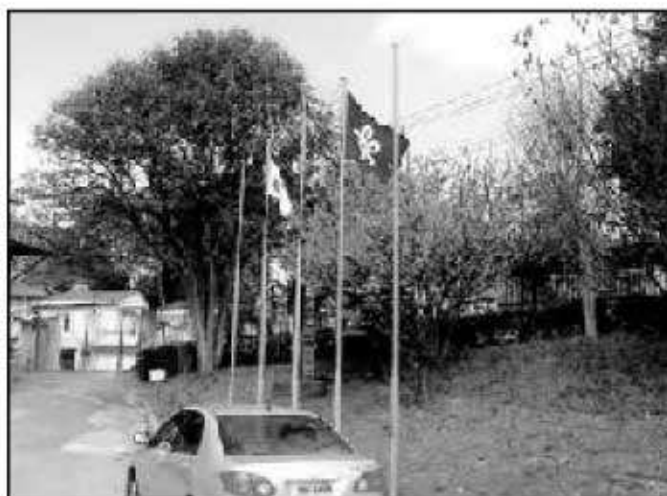
好天气に恵まれ、県旗も招くが参加者の期待する知事の顔はなく