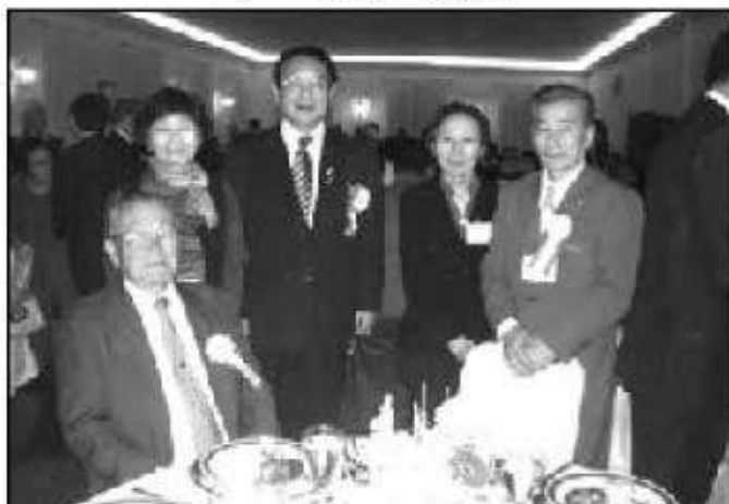
麻生知事を囲んで