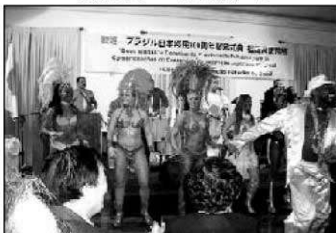
サンパ ショウの踊り子たち