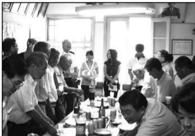
県人会会館でおこなわれた歓迎会にて