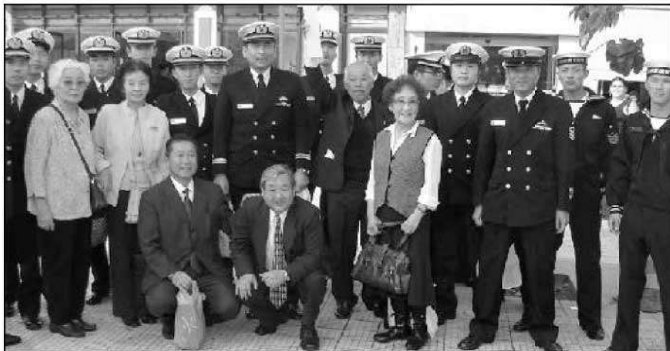
福岡県出身の海上自衛隊隊員とブラジル福岡県人会の歓迎会参加者と

10.00時から文協にて行なわれた海上自衛隊の歓迎会の後 福岡県出身の自衛隊員43名の内 23名の隊員を集め、県人会主催歓迎会を16名の会員を交え、レストラン誠（まこと）で行なう