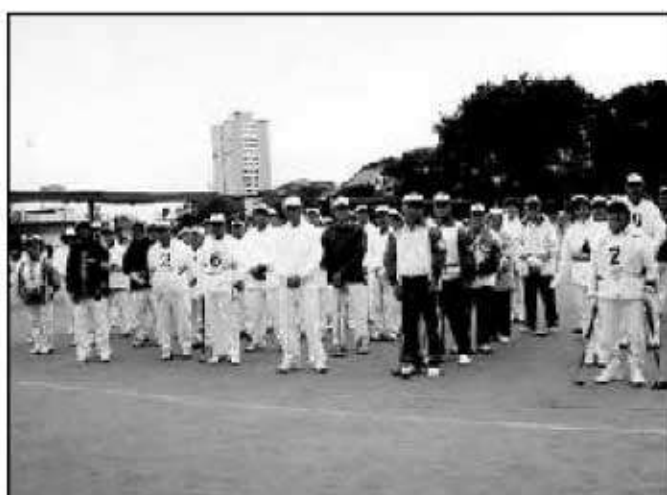
決勝大会参加全チーム揃って