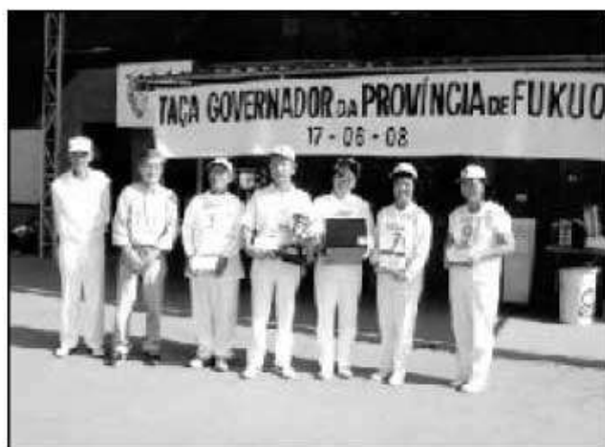
優勝したピラ マチウダ B チーム