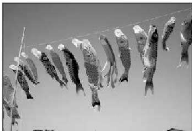
6メートルの大きな鯉のぼりにおとな達も大喜び