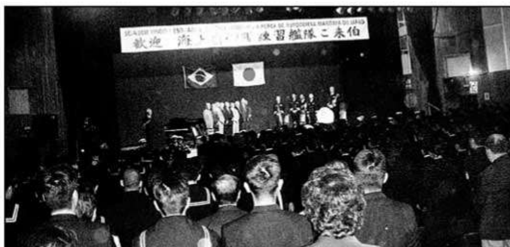
文化協会で合同歓迎会がおこなわれた