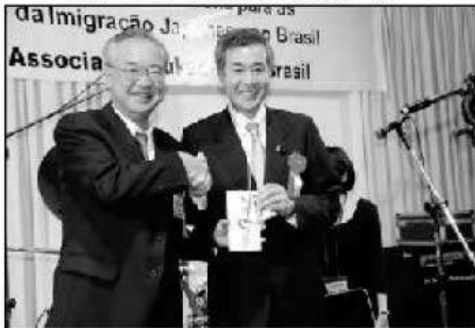
福岡県からのお祝いの贈呈